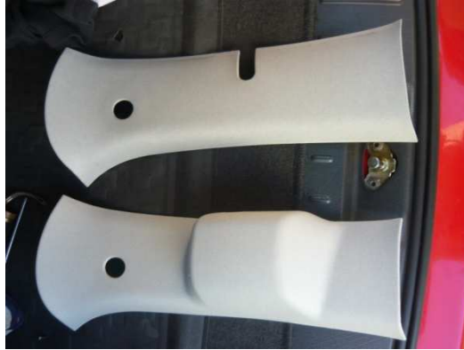
Přichytka na D sloupek

Kryt D sloupku (rozdíl oproti mechanickému ovládní)