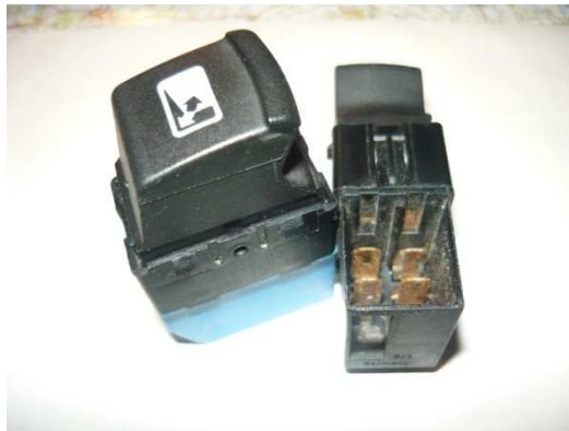
Konektor pro ovládací tlačítka